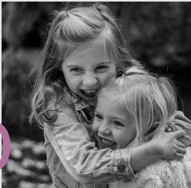
I PER ELLES