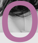
ESTEM PER TU