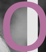
I PER TU