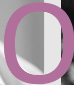
PER ELL, TAMBÉ