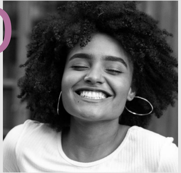
I PER ELLA